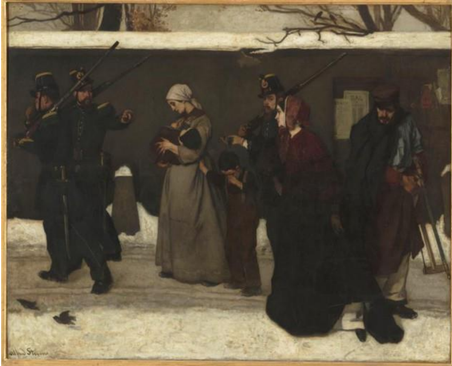
Alfred Stevens (1823-1906) Ce qu'on appelle le vagabondage 1854 Huile sur toile H. 130 ; L. 165 cm Musée d'Orsay