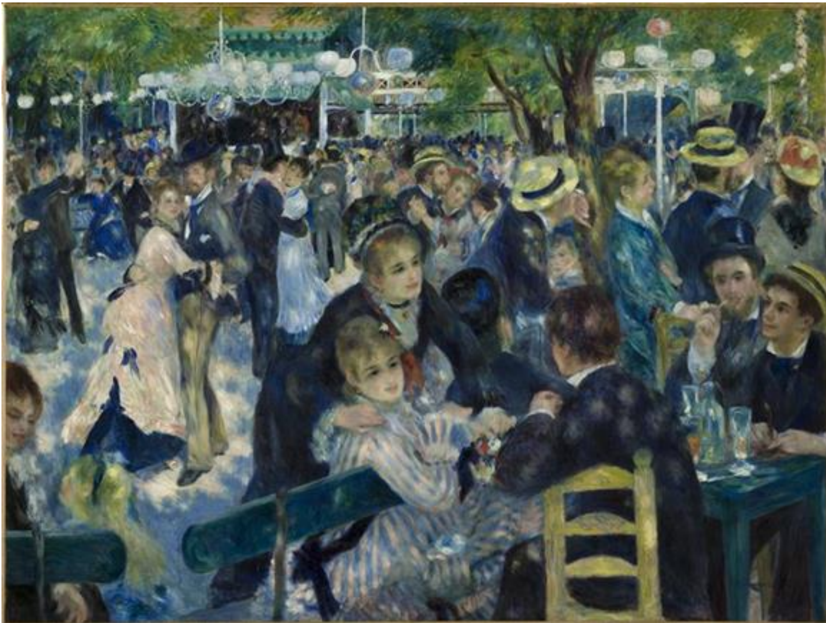
Bal du Moulin de la Galette Renoir Auguste (1841-1919)