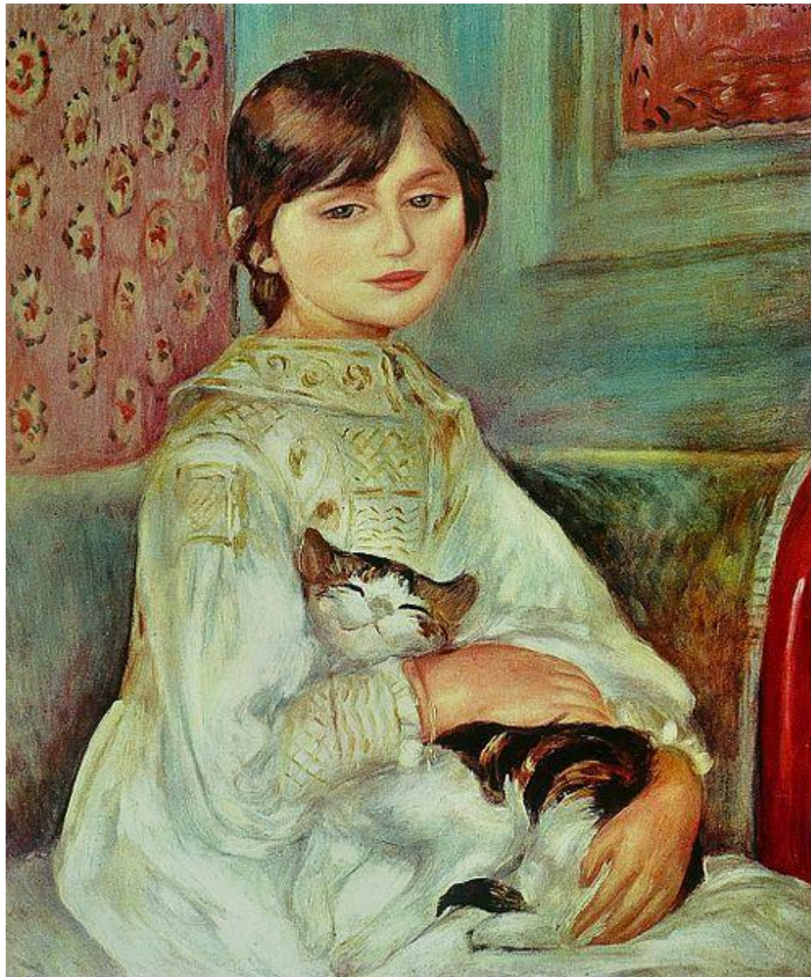
Pierre Auguste Renoir Julie Manet ou L'Enfant au Chat