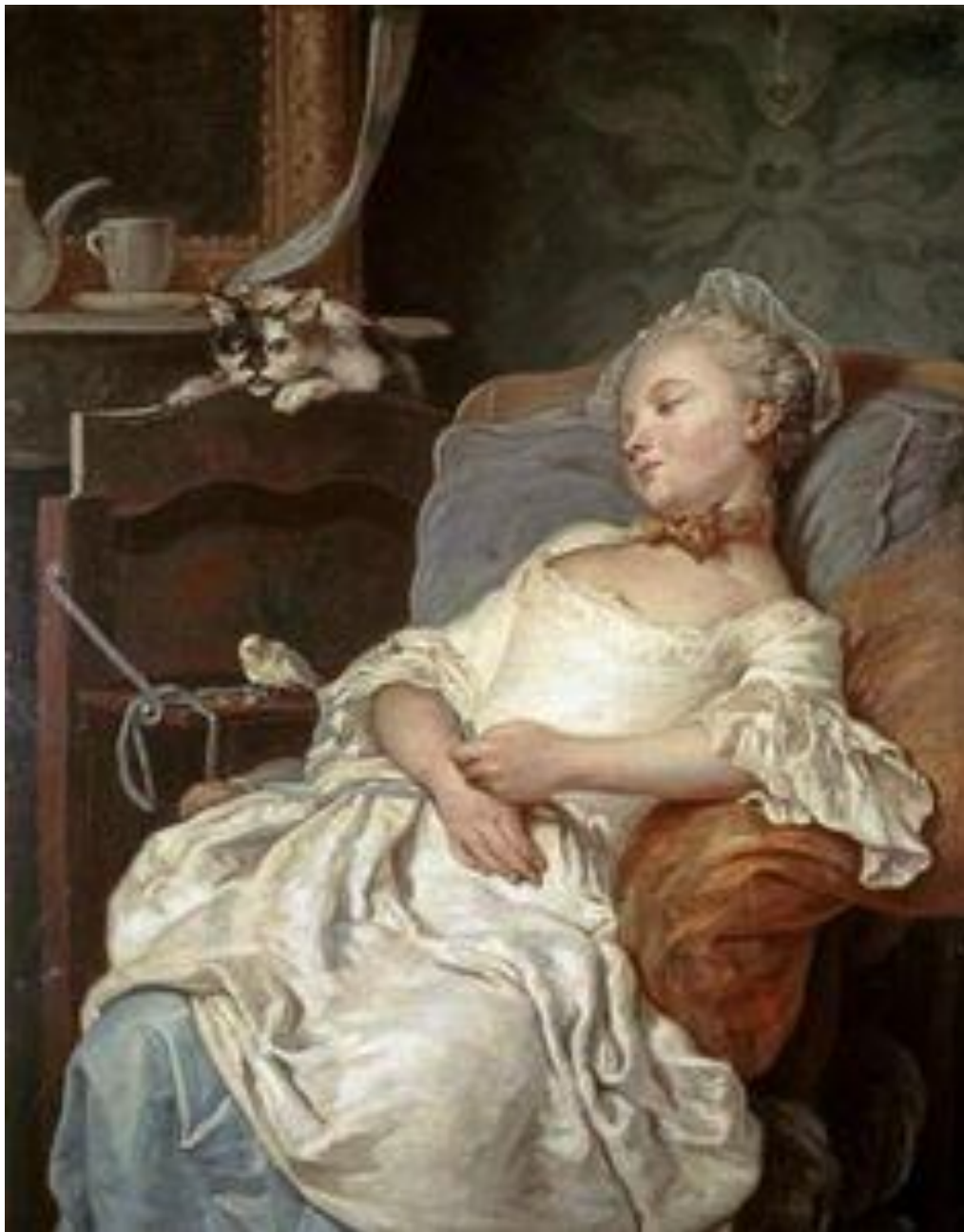
Colson, Jean-François Gilles, Le repos , 1759 Huile sur toile H: 0,93 m L: 0,73 m Musée des Beaux Arts-Dijon