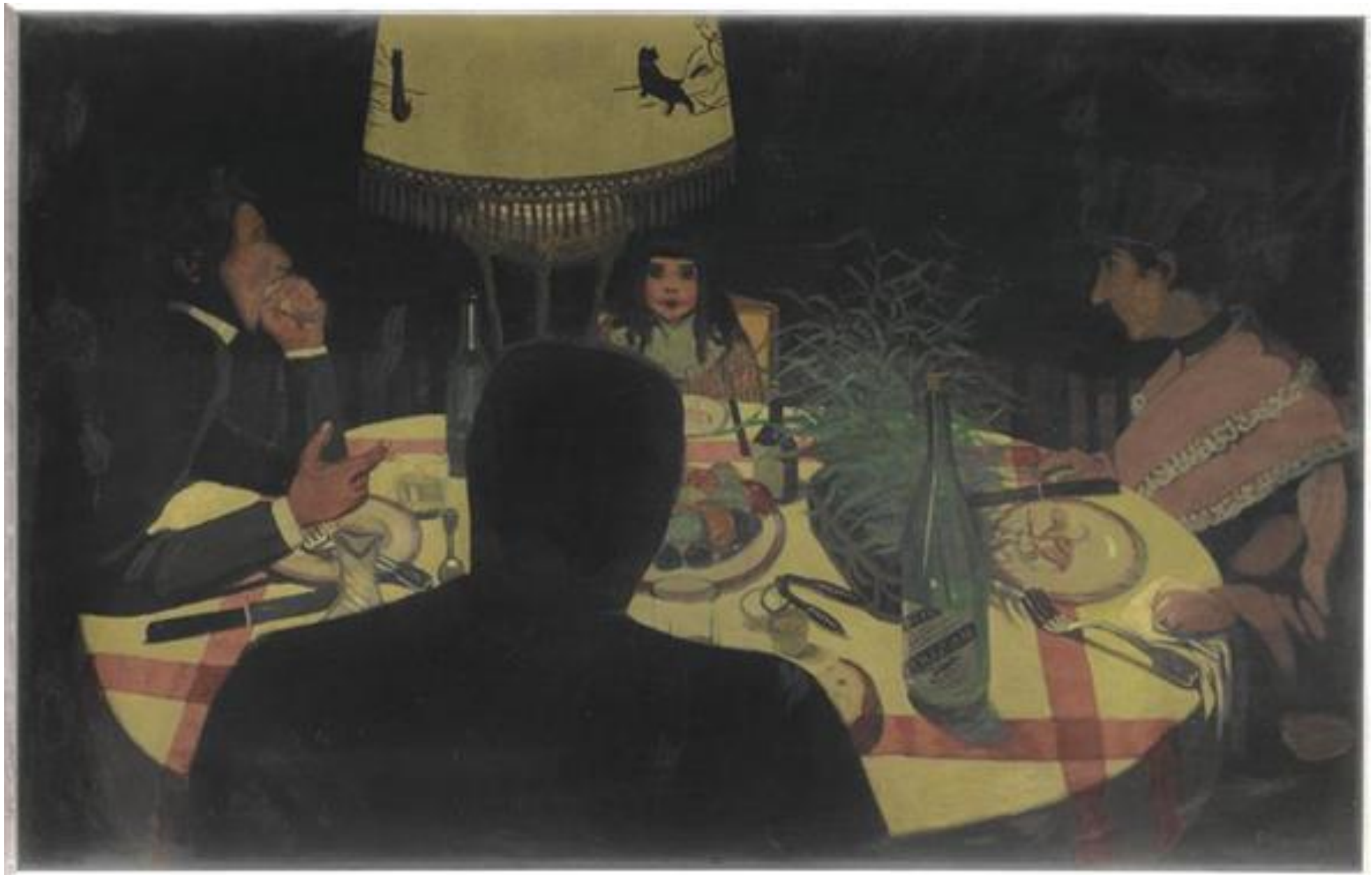
Vallotton Félix, Le Dîner, effet de lampe, 1899 H: 0,57 m; L: 0,895m